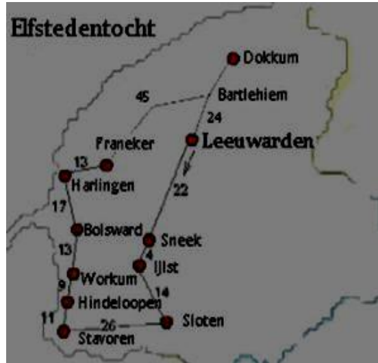
Het traject van de elfstedentocht